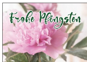
Impulskarte, DIN A7, 4 Seiten