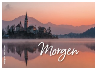
Flyer, DIN A6, 4 Seiten

Auch als DIN A3 Schaukastenposter erhältlich.