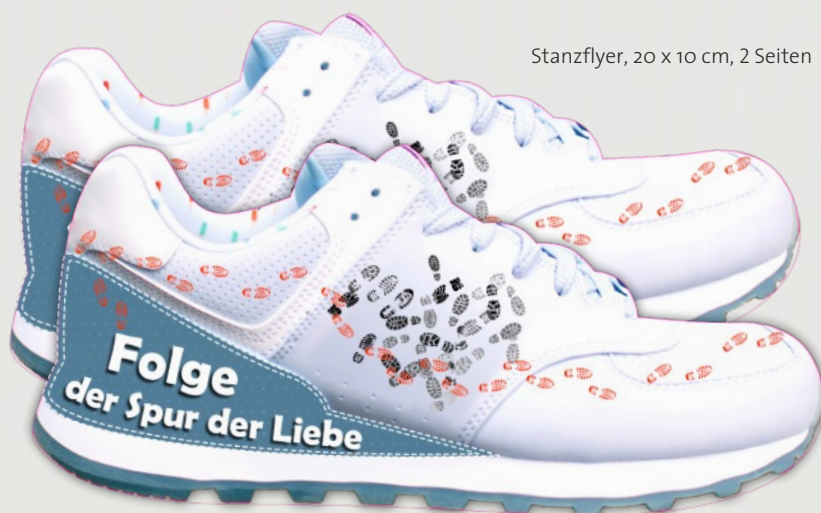
Stanzflyer, 20 x 10 cm, 2 Seiten

Der Flyer ist auch für größere Verteilaktionen geeignet.